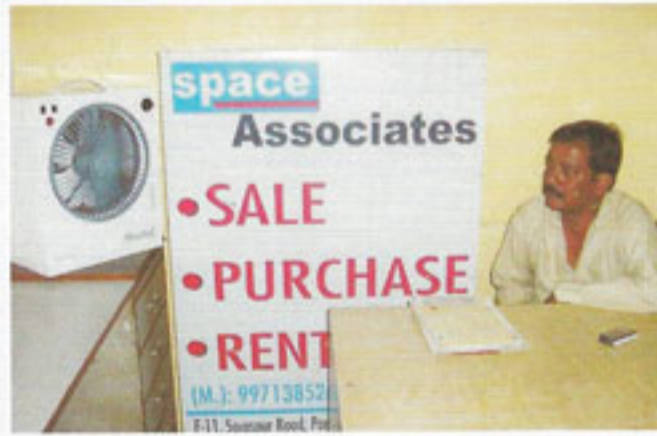
स्पेस एसोसिएट, पांडव नगर, नई दिल्ली

तिवारी पान भंडार के विक्रेता के अनुसार उन्हें गर्मियों के लिए शीतल मिनी कूलर के रूप में एक वरदान मिल गया है। गर्मी में पंखा फेल हो जाता है। कूलर से उन्हें बहुत राहत मिलती है। सबसे अच्छी बात जो उन्हें पसन्द है वह यह है कि शाम को घर जाते समय वह इसे आसानी से उठाकर लेकर चले जाते हैं और सुबह पुनः लेकर चले आते हैं। ■