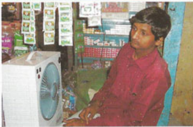
तिवारी पान भंडार, समसपुर रोड, दिल्ली

तिवारी पान भंडार के विक्रेता के अनुसार उन्हें गर्मियों के लिए शीतल मिनी कूलर के रूप में एक वरदान मिल गया है। गर्मी में पंखा फेल हो जाता है। कूलर से उन्हें बहुत राहत मिलती है। सबसे अच्छी बात जो उन्हें पसन्द है वह यह है कि शाम को घर जाते समय वह इसे आसानी से उठाकर लेकर चले जाते हैं और सुबह पुनः लेकर चले आते हैं। ■