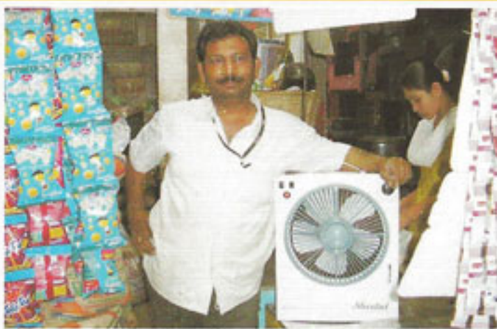
श्री श्याम ट्रेडर्स, जनरल स्टोर, पांडवनगर

श्री श्याम ट्रेडर्स के संचालक के अनुसार शीतल मिनी कूलर उनकी दुकान के लिए बहुत अच्छा है। दुकान के किसी भी कोने में रख देने पर सामान नहीं उड़ता और न ही बिखरता है। इसकी बॉडी सुन्दर होने के कारण दुकान में रखने पर अच्छा लगता है, आवाज नहीं करने के कारण ग्राहकों को कोई असुविधा नहीं होती है। ■