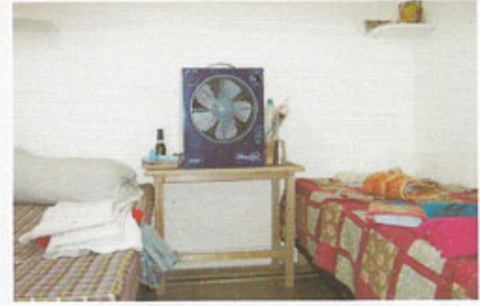
राहुल पी.जी. हाउस, साउथ एक्स, नई दिल्ली

स्पेस एसोसिएट के प्रबंधक के अनुसार यह शीतल मिनी कूलर दुकान और घर दोनों के लिए बहुत अच्छा है। 10 × 12 फुट तक के कमरे को यह पूरी तरह ठंडा करने में सक्षम है। उनके अनुसार जिन स्थानों पर ए.सी. नहीं लग सकता वहां भी यह कूलर आसानी से लगाया जा सकता है और ए.सी. जैसा आनन्द लिया जा सकता है। ■