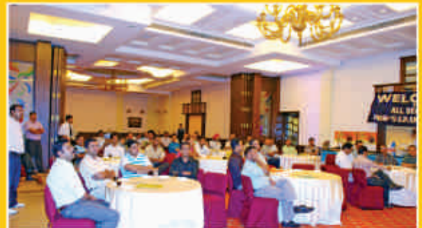
मीटिंग में उपस्थित डीलरगण